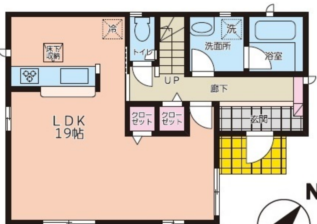
1 F : 49.41 m 2